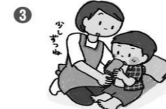
③ 水分を少しずつ与える

麦茶や子ども用イオン飲料などをひと口ずつ与える。一度に飲ませず、様子を見ながら。