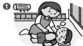
① 涼しい場所に移動する

子どもたちが大好きな夏ですが、熱中症には注意を。子どもに異変があったら、すぐに手当てをして重症化を防ぎましょう。